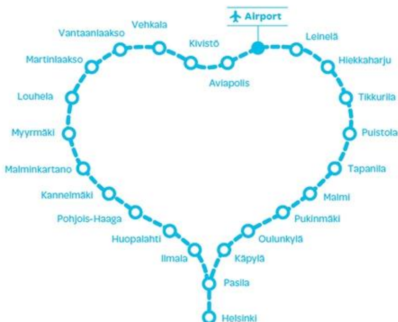
Схема движения поездов Хельсинки-Аэропорт

Поезда ходят по кругу, можно садиться на любой, и он довезет до центрального ж/д вокзала (Конечная остановка — главный железнодорожный вокзал Хельсинки).